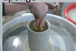
Essuyer le bord